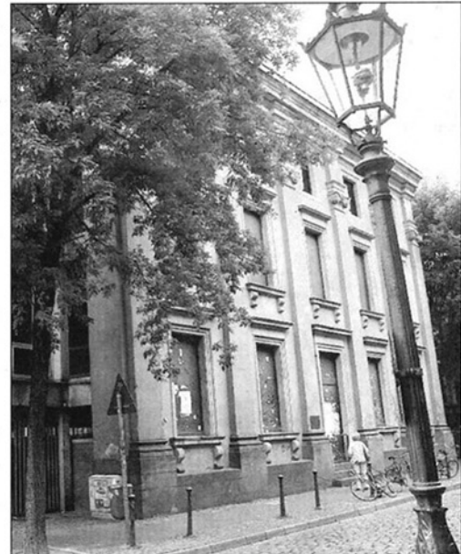
Mehr Sensibilität als an der Ratinger Straße fordern die Fachleute.