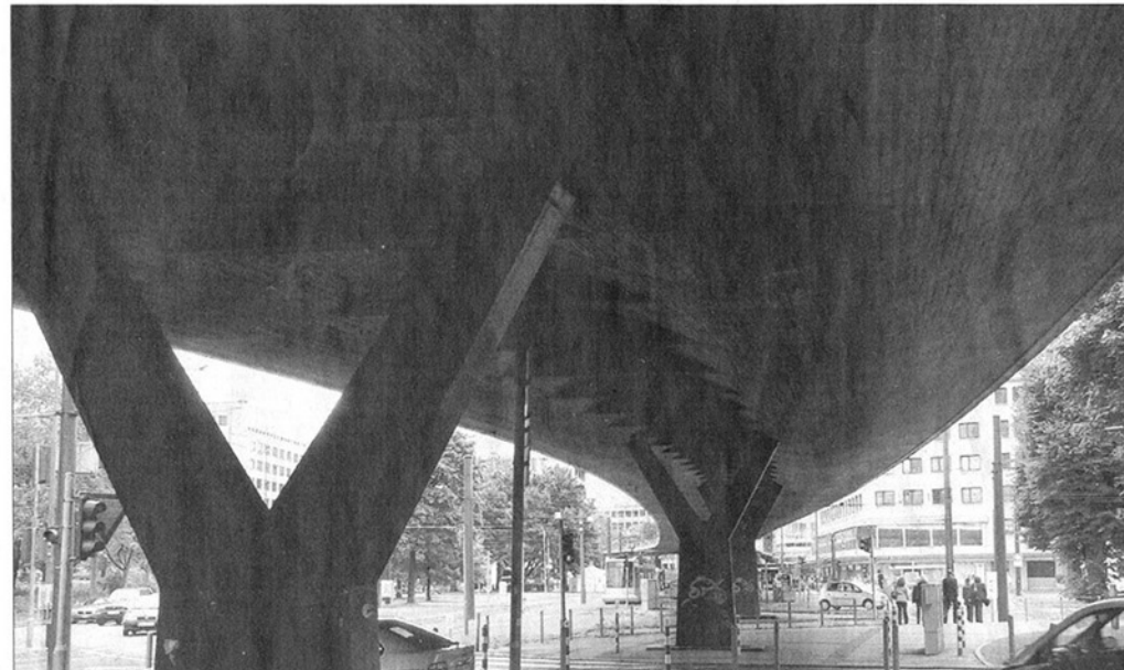
Alle Denkmal-Berater appellieren an die Stadt, den Tausendfüßler als Zeugnis der Nachkriegsarchitektur zu erhalten.

(H.M.). Die Karlstadt-Satzung sieht vor, dass alle gestalterischen Bau-Maßnahmen zwischen Rhein und Kö-Westseite, Haroldstraße, Graf-Adolf-Platz und Trinkausstraße mit der Denkmalbehörde abzustimmen sind. Krecklau, der vor einigen Jahren das Hotel Orangerie beispielhaft in die Karlstadt eingefügt hat, findet das selbstverständlich. Das sei keine Frage der Denkmalpflege, sondern Ausdruck eines harmonischen Stadtbildes. Das sollte die Verwaltung generell fordern. Bramlage und Döring verweisen auf Italien, wo man an allen wichtigen Orten zuerst das Kunst-Ministerium fragen müsse. Ein hohes Lied singen sie auf Maastricht, wo Top-Leute im Gestaltungsbeirat sitzen. „Dort gibt es keine Plastikmöbel oder Marlboro-Sonnenschirme.“ Ein Gestaltungsbeirat wäre auch in Düsseldorf die sinnvolle Ergänzung. Bramlage möchte dort keinerlei Politiker, sondern nur Fachleute sehen.